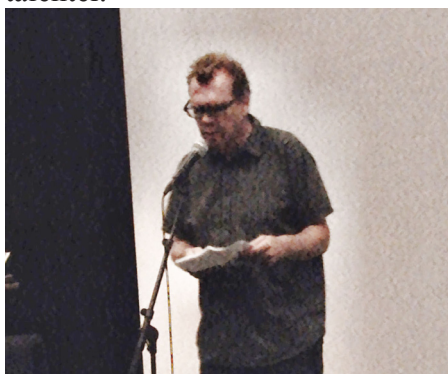
Frode Grytten åpner festivalen

Raptus er offisielt åpnet av forfatteren Frode Grytten og vi er klar for en spennende helg med både etablerte serieskapere og nye talenter.