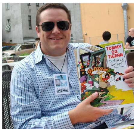
The Tiger Henter Himself