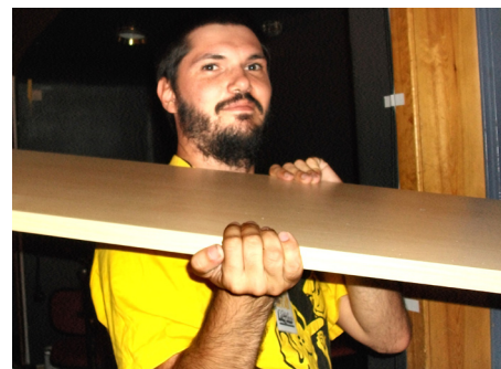
Full fart mot festivalen!

Raptus blir ikke til av seg selv, men er bygget av en rekke frivilliges arbeidsinnsats. Mens noen holder på året rundt, er de fleste med bare i denne hektiske helgen. Stå på alle sammen!